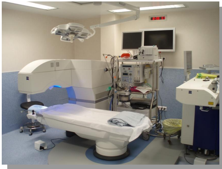
Salle Laser – Bloc opératoire Clinique Monticelli

La clinique Monticelli offre un plateau technique disposant des dernières avancées dans ce domaine. Au sein du bloc opératoire, une salle d'intervention a été dédiée afin de permettre le couplage d'un Laser Femtoseconde VISUMAX avec un laser Excimer MEL 80 de marque ZEISS qui sont utilisés pour la chirurgie réfractive mais également pour la kératoplastie (greffe de cornées). Une telle organisation permet une plus grande sécurité et une meilleure efficacité de ces procédures opératoires.