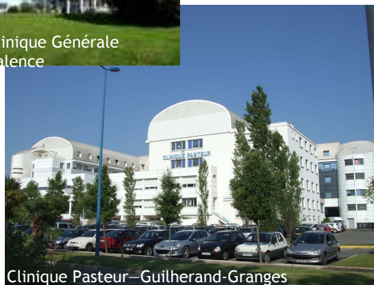
Clinique Pasteur – Guilhaumand-Granges