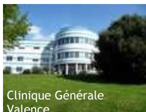
Clinique Générale Valence

www.reseau-concorde-org www.oncoranet.lyon.fnclcc.fr www.ligue-cancer.net www.hpda.fr